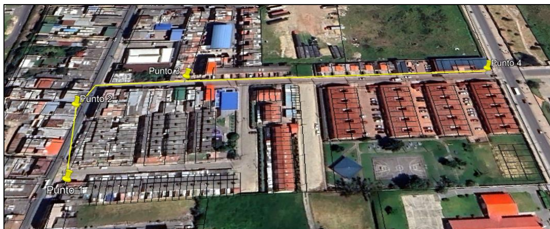
Ilustración 1. Recorrido

Se realizó recorrido de control y vigilancia en el cuadrante 2, barrio NUEVA GERONA el día 23 de abril del 2024, desde las coordenadas 4°42'35.790" N - 74°12'35.748" W hasta las coordenadas 4°42'42.248" N - 74°12'30.250" W (ver ilustración 1. Ruta amarilla), con el fin de verificar las condiciones ambientales, identificar posibles afectaciones a los recursos naturales y realizar las acciones de prevención correspondientes.